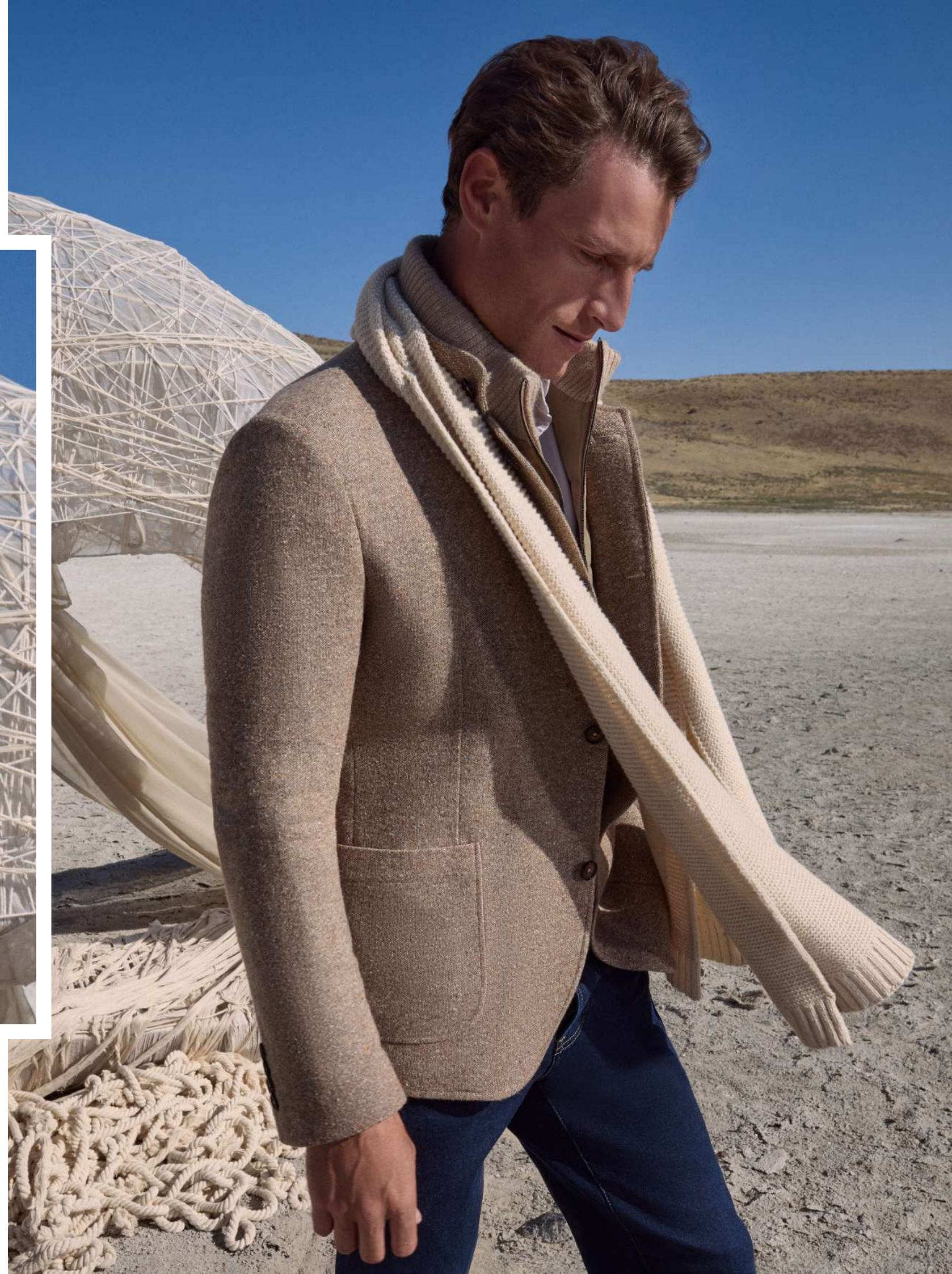
Ceket: AK25264WDZ001 Atkı: AK25EA27CZ001