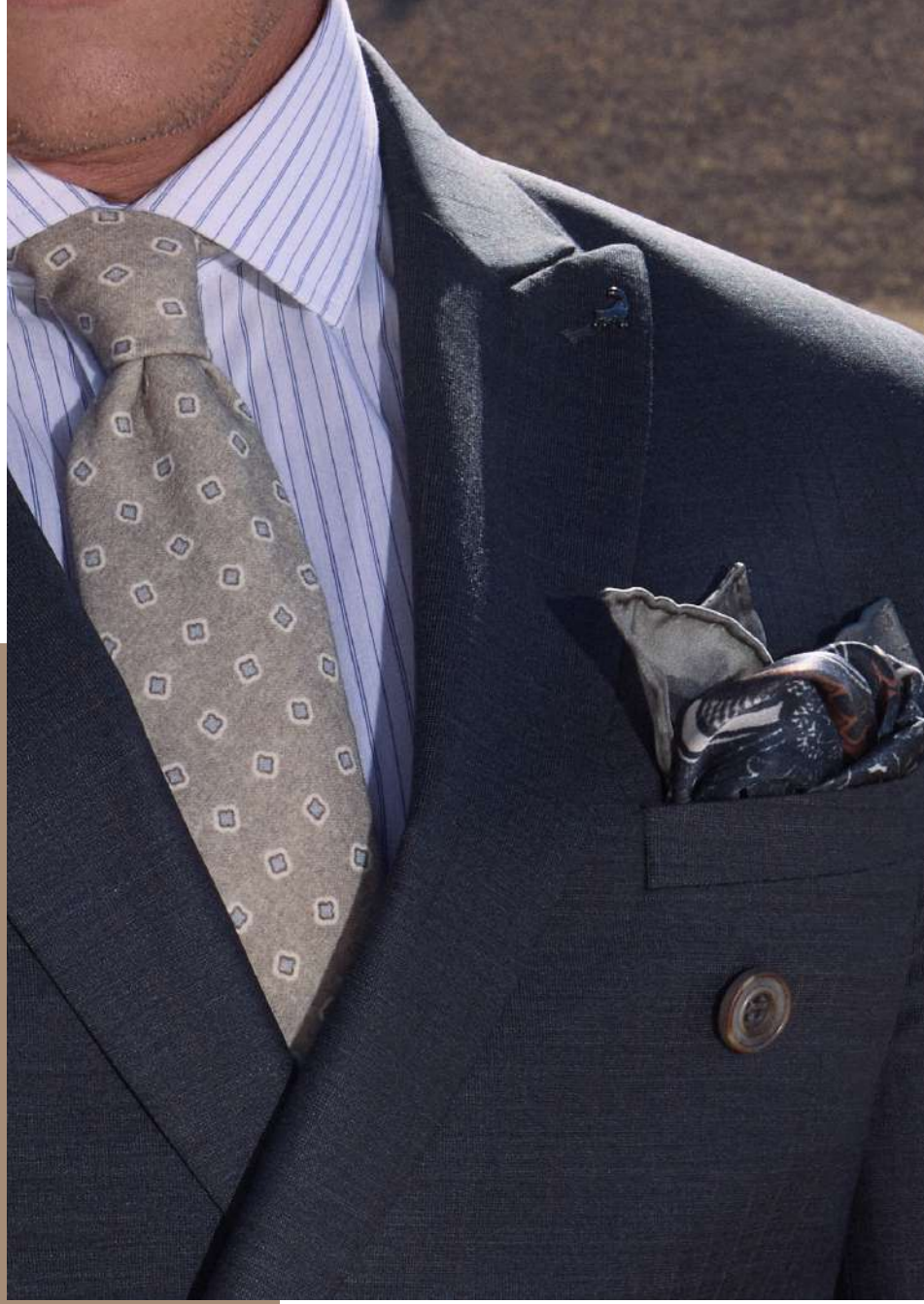
Takım Elbise: ASSZ1U91CZ014 Q20 Mendil: ASSZIB60DS006 Q10 Kravat: ASSZHE30DS001810 Gömlek: AY244CX0CZ003 900